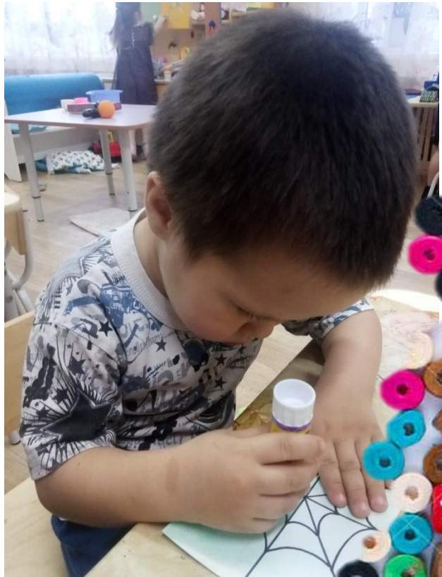
SHOT ON M6T MEIZU