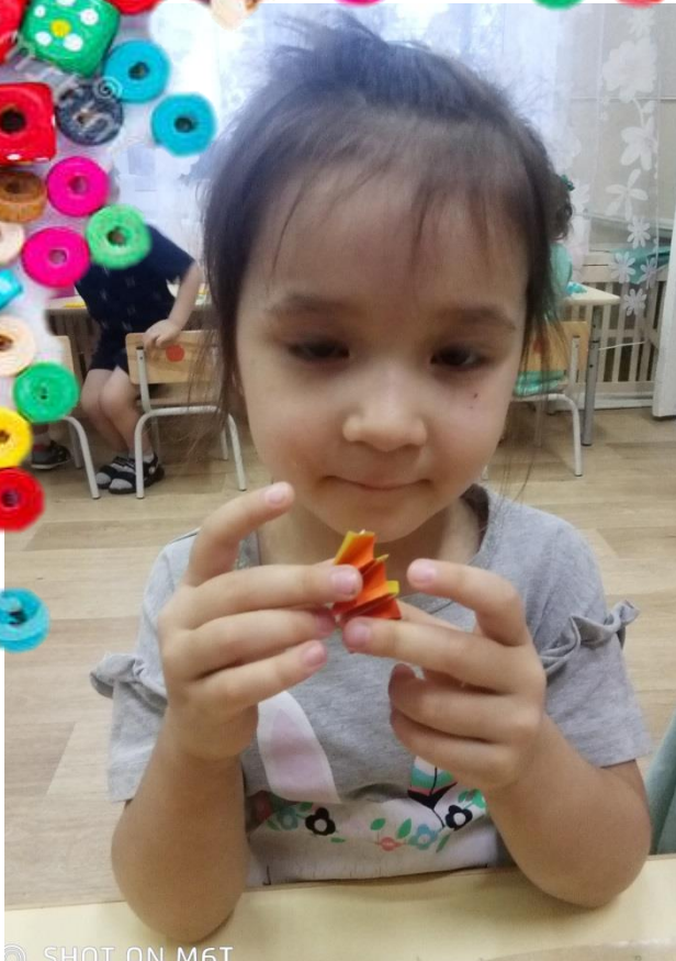
SHOT ON M6T