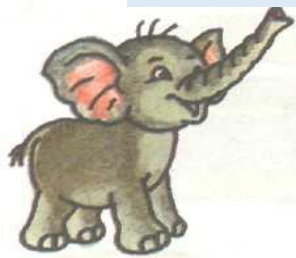
«Лягушка и слоник»