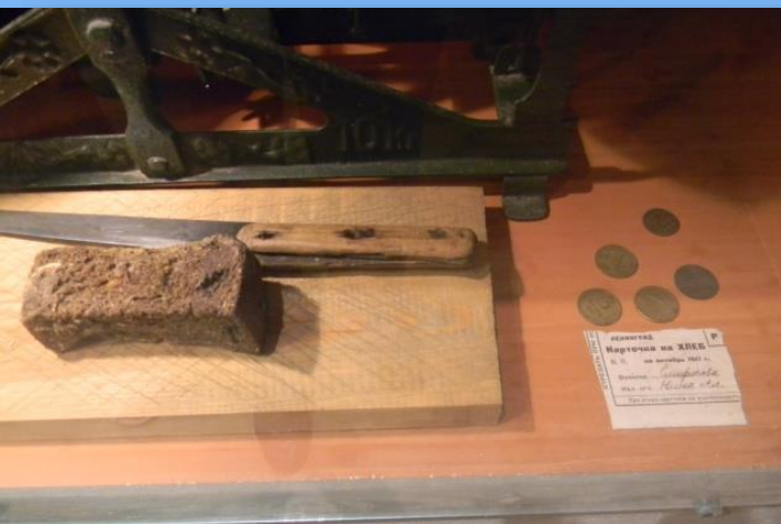
НОРМЫ ВЫДАЧИ ХЛЕБА НАСЕЛЕНИЮ ЛЕНИНГРАДА (В ГРАММАХ)