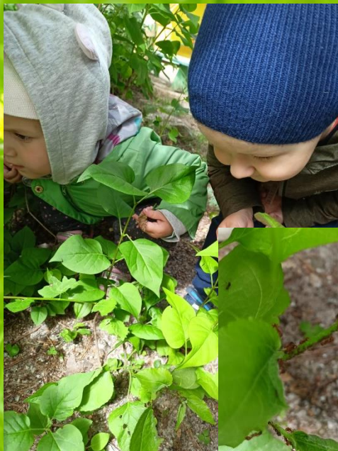
Тля и муравьи